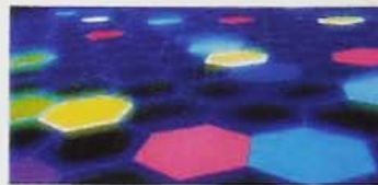
塗装表面イメージ